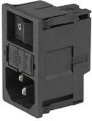
Gerätesteckerkombielement Übersicht komplett

KM, Montage:Steckanschlüsse 4.8 x 0.8 mm, Sicherungshalter: 1-/2-polig, Wippenschalter, unbeleuchtet, 2-polig, Gerätestecker: IEC C14, 250 VAC, verdrahtet, Geeignet für Geräte der Schutzklasse I oder II